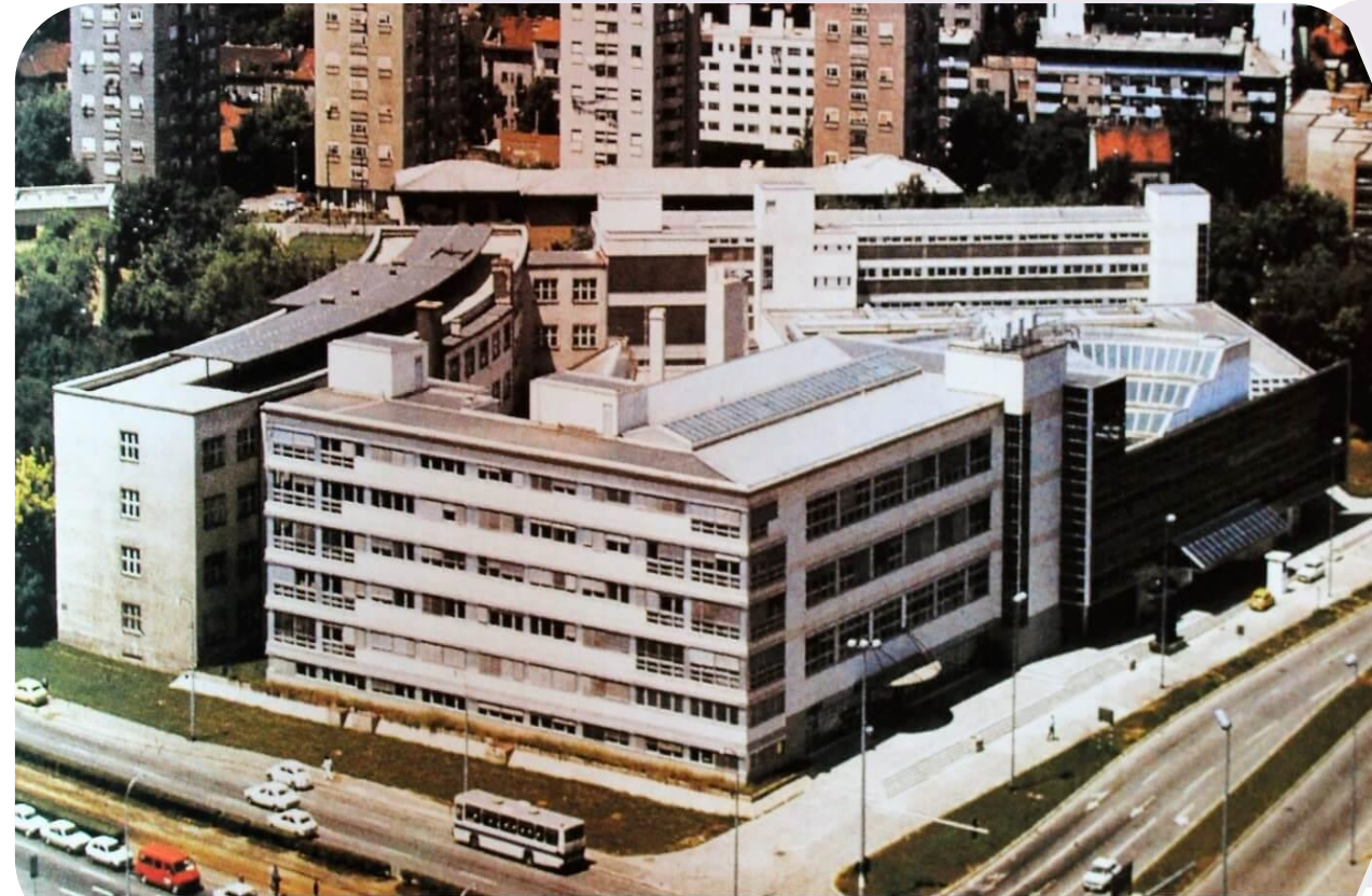
Ekonomski fakultet - Zagreb u vrijeme Univerzijade 1987.